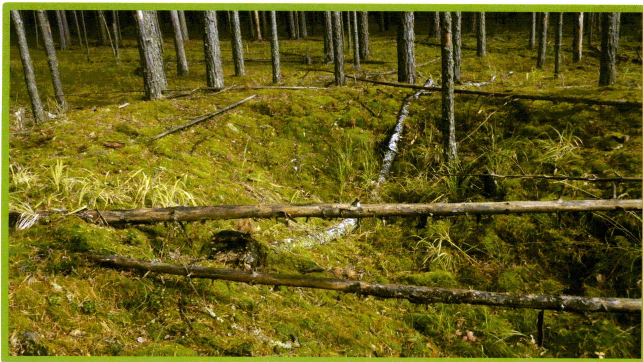
Изображение № 1 Валежник

Примеры валежника (смотри изображения №№ 1,2,3).