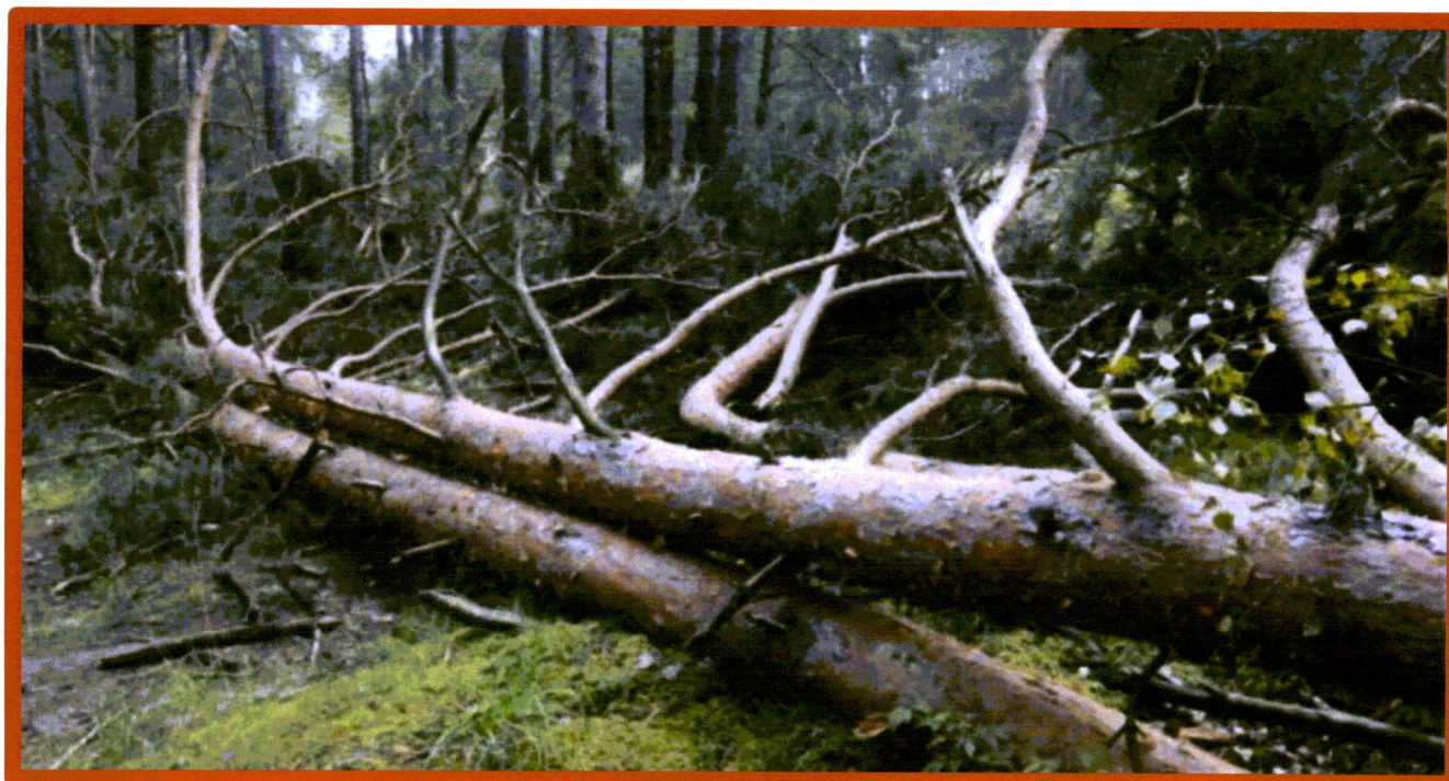
Лежащее на поверхности земли ветровальное дерево, не имеющее признаков отмирания. Не является валежником

Кроме того, необходимо обратить внимание, что деревья, которые лежат на земле, но не имеют признаков естественного отмирания (имеют зеленую листву или хвою), определять как «мертвые» не допускается (смотри изображение № 5).