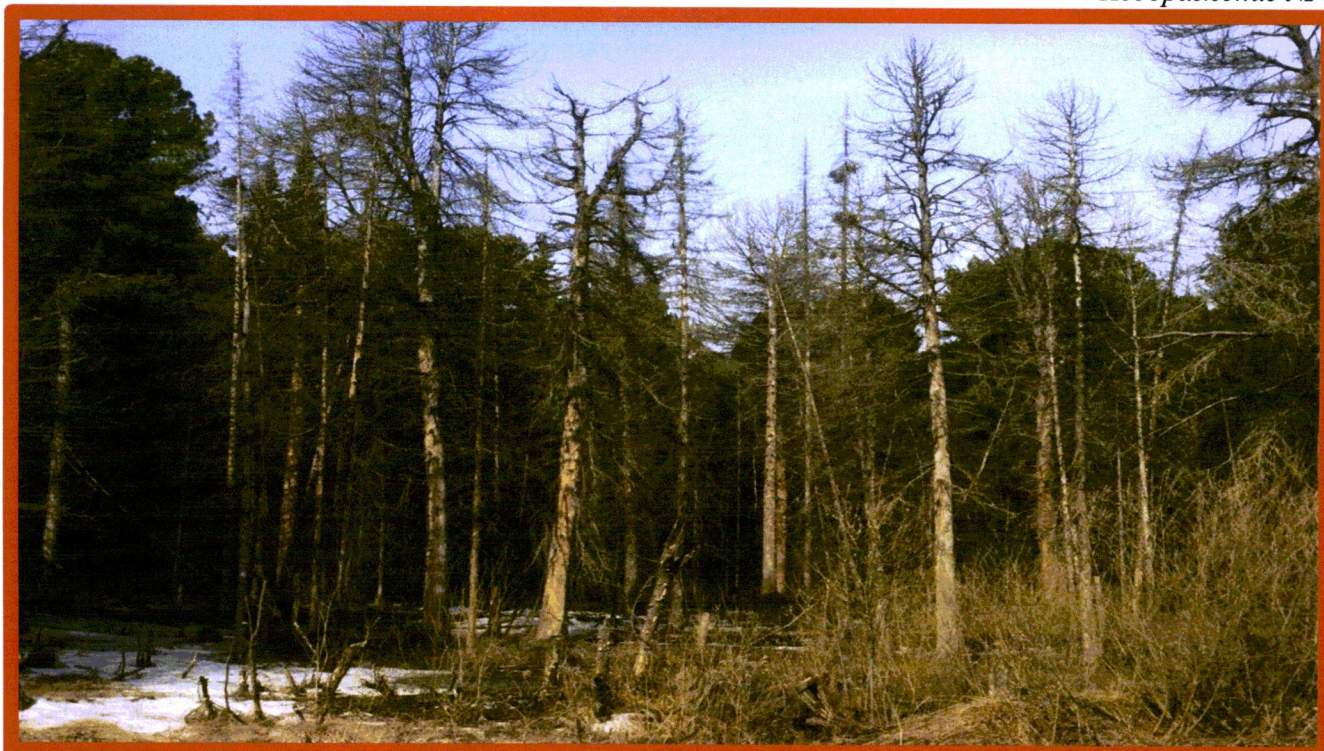
Изображение № 4 Сухостойное дерево. Не является валежником Изображение № 5

Кроме того, необходимо обратить внимание, что деревья, которые лежат на земле, но не имеют признаков естественного отмирания (имеют зеленую листву или хвою), определять как «мертвые» не допускается (смотри изображение № 5).