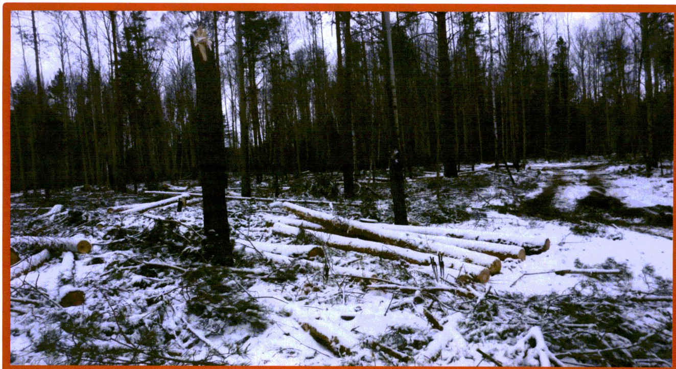
Изображение № 7 Брошенная древесина вдоль лесовозных дорог. Не является валежником